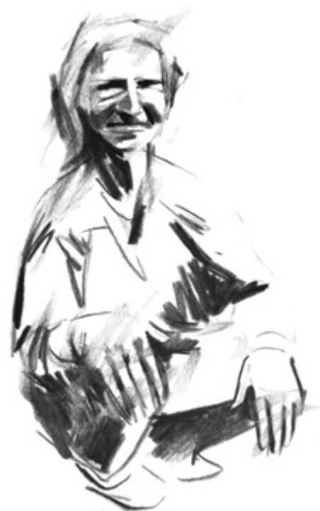
Illustrations : Aurélie Moineau